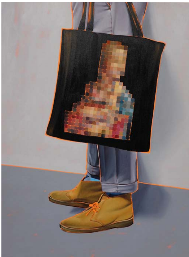
Arty farty Hermelin Öl auf Leinwand 120 x 90 cm