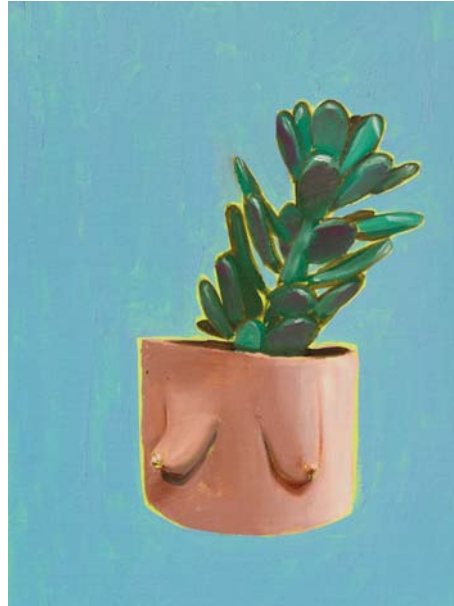
Just hanging 5 Öl auf Karton 40 x 30 cm