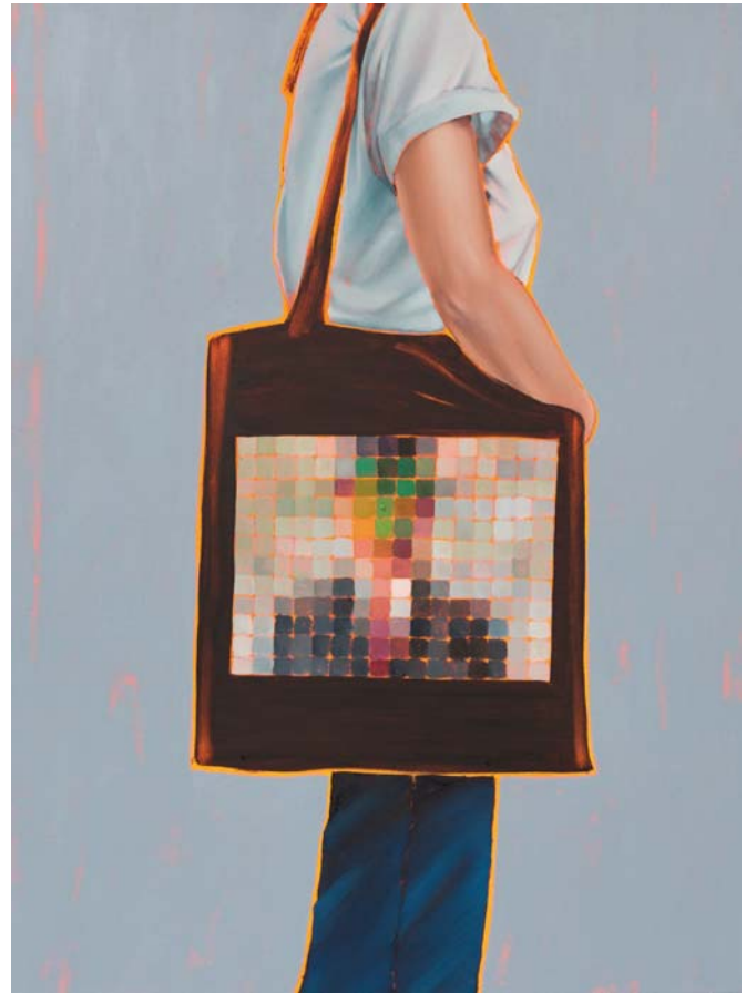
Arty farty Son of man Öl auf Leinwand 120 x 90 cm