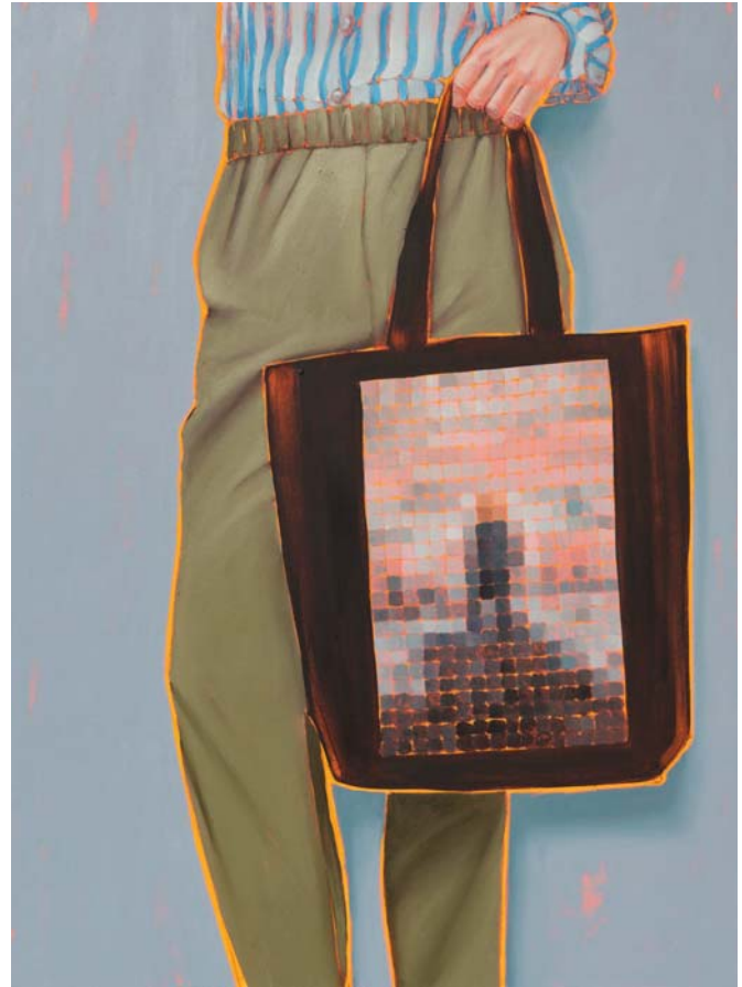
Arty farty Wanderer Öl auf Leinwand 120 x 90 cm