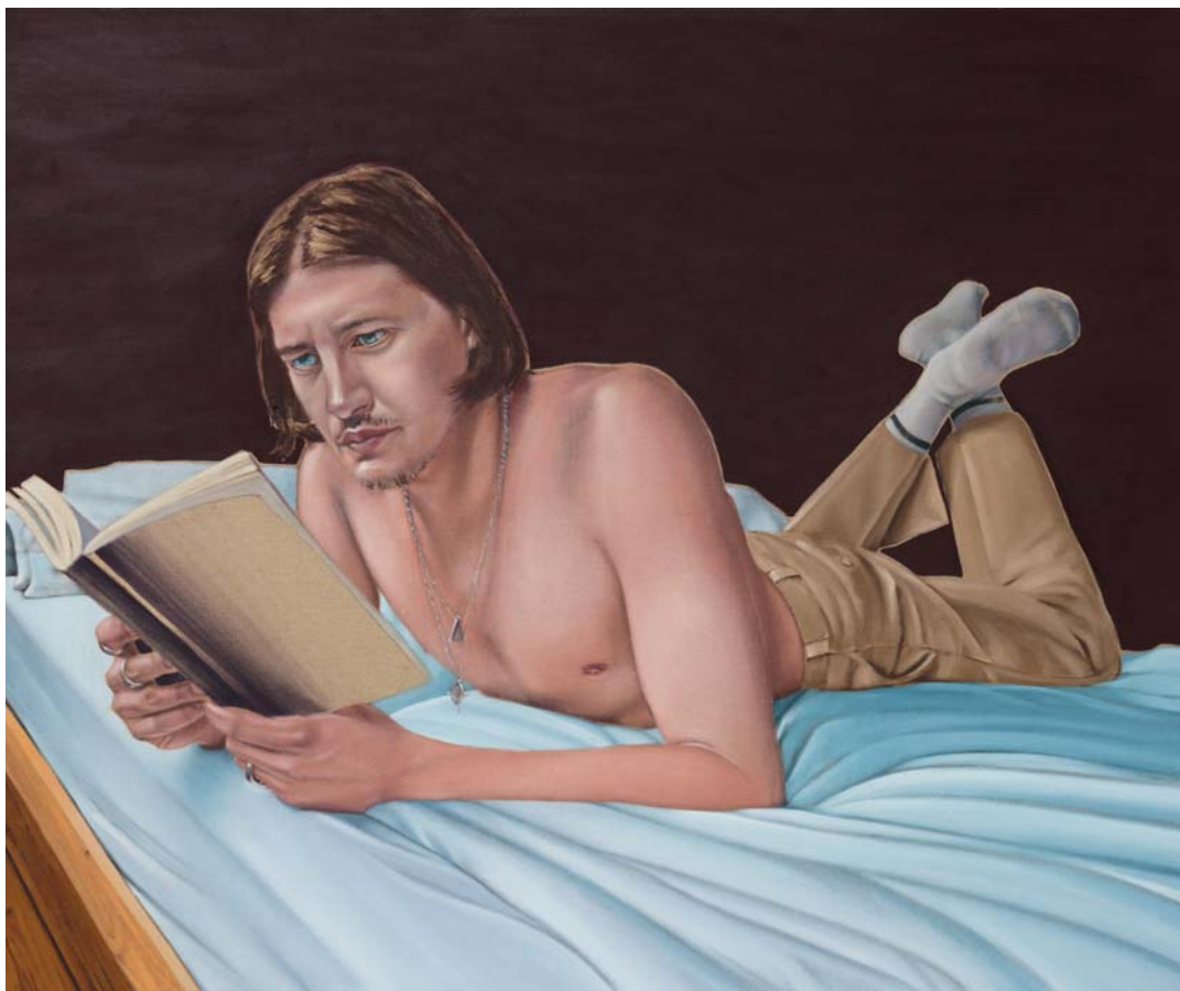
The reader Öl auf Leinen 115 x 160 cm