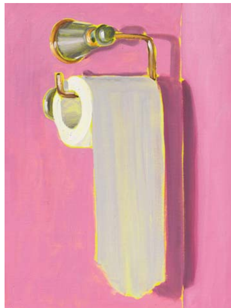
Just hanging 4 Öl auf Karton 40 x 30 cm