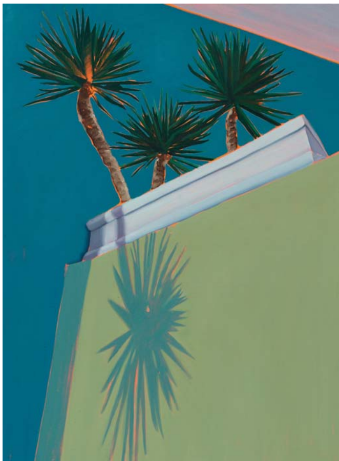
3 Amigos Öl auf Leinwand 120 x 90 cm