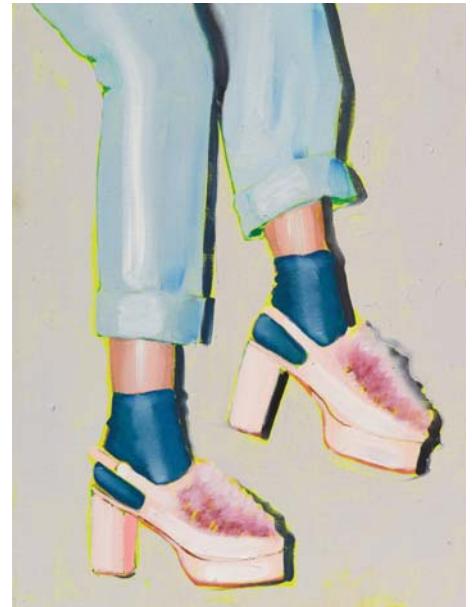
Just hanging 8 Öl auf Karton 40 x 30 cm