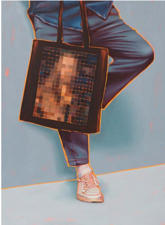
Arty farty Self portrait Öl auf Leinwand 120 x 90 cm