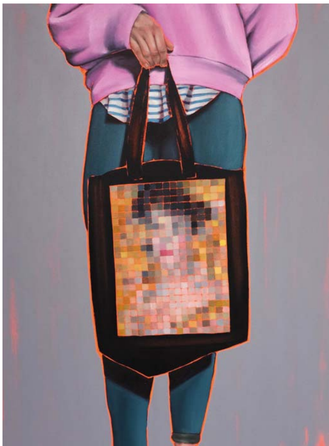
Arty farty Adele Öl auf Leinwand 120 x 90 cm