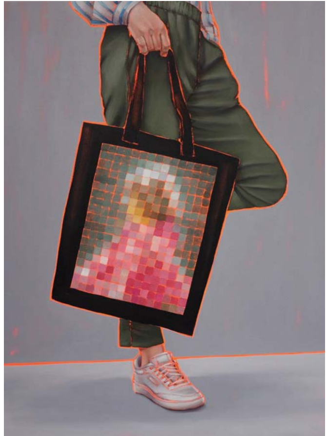
Arty farty Betty Öl auf Leinwand 120 x 90 cm