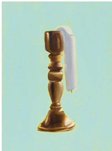
Just hanging 1 Öl auf Karton 40 x 30 cm