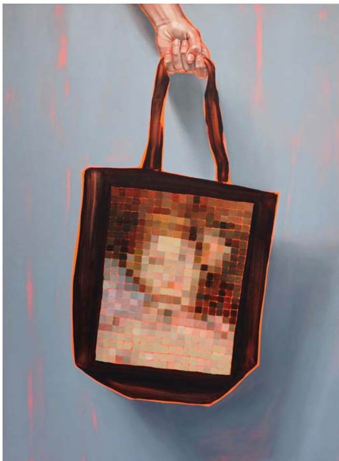
Arty farty Olympia Öl auf Leinwand 120 x 90 cm