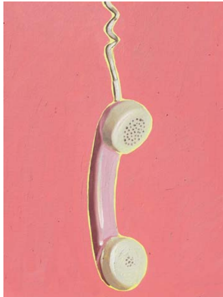
Just hanging 7 Öl auf Karton 40 x 30 cm