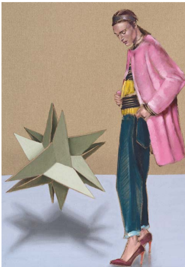
Easy lover Öl auf Leinen 70 x 50 cm