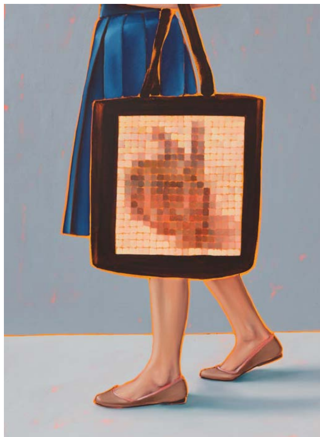
Arty farty Young hare Öl auf Leinwand 120 x 90 cm