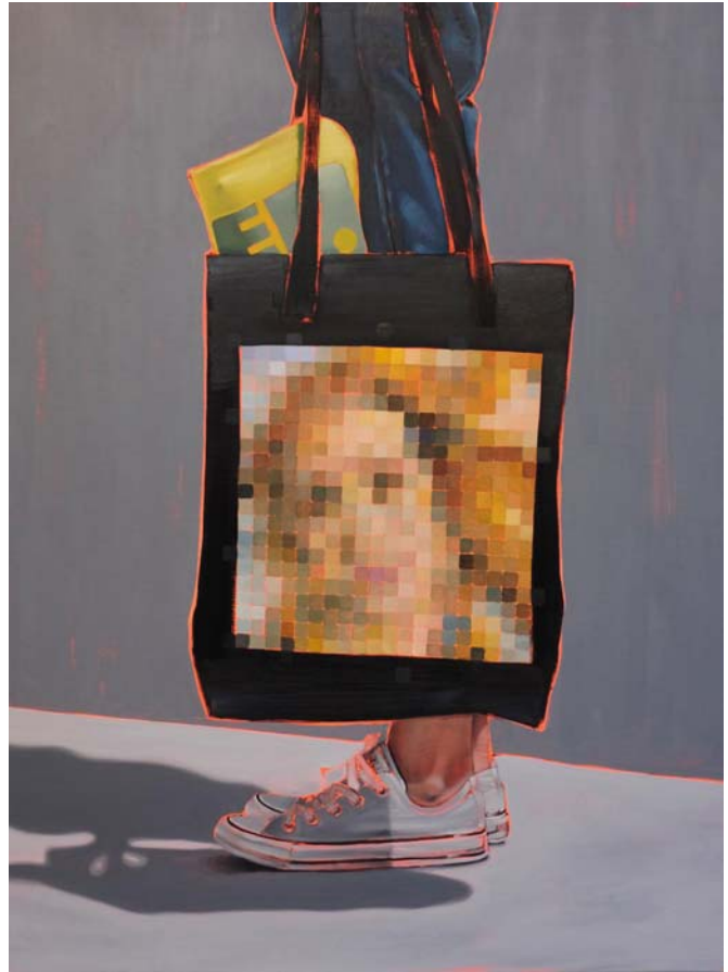
Arty farty Venus Öl auf Leinwand 120 x 90 cm