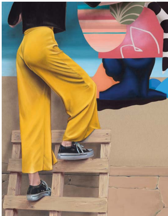
Femme peintre avec palette Öl auf Leinen 140 x 110 cm