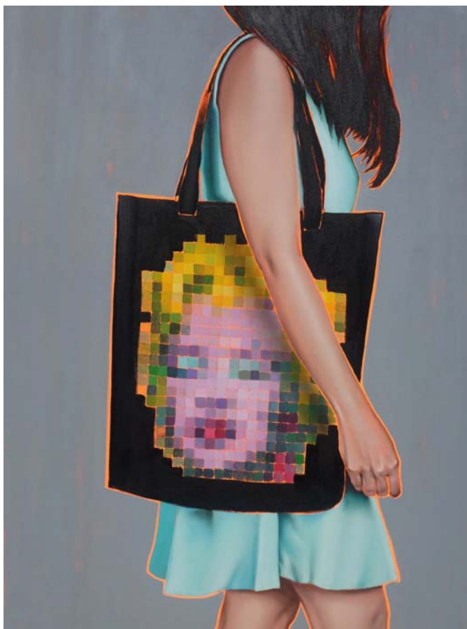
Arty farty Marilyn Öl auf Leinwand 120 x 90 cm